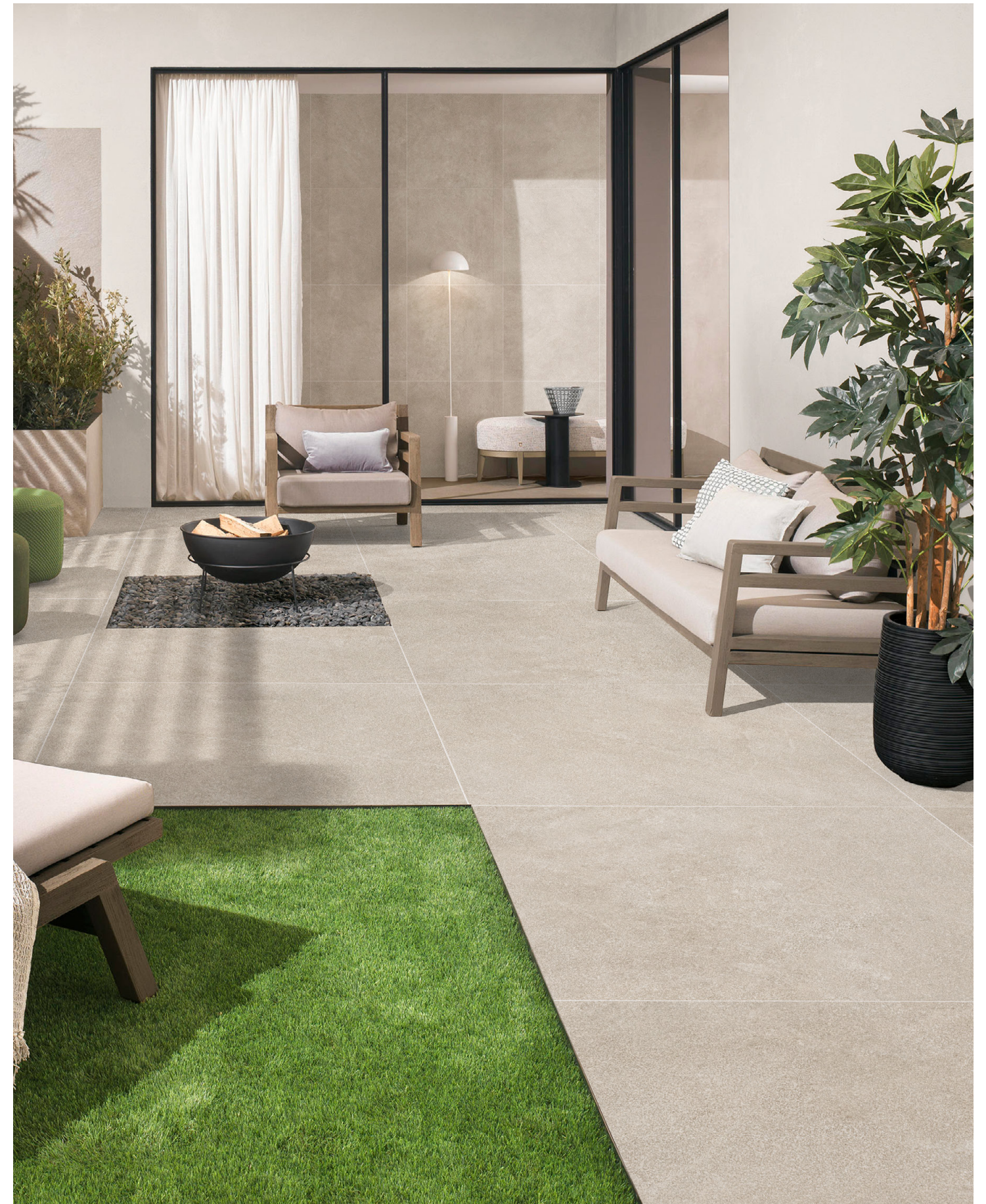
▼ ANDRATX CREAM 90x90 cm | 36"x36"