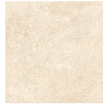
ANDRATX | CREAM