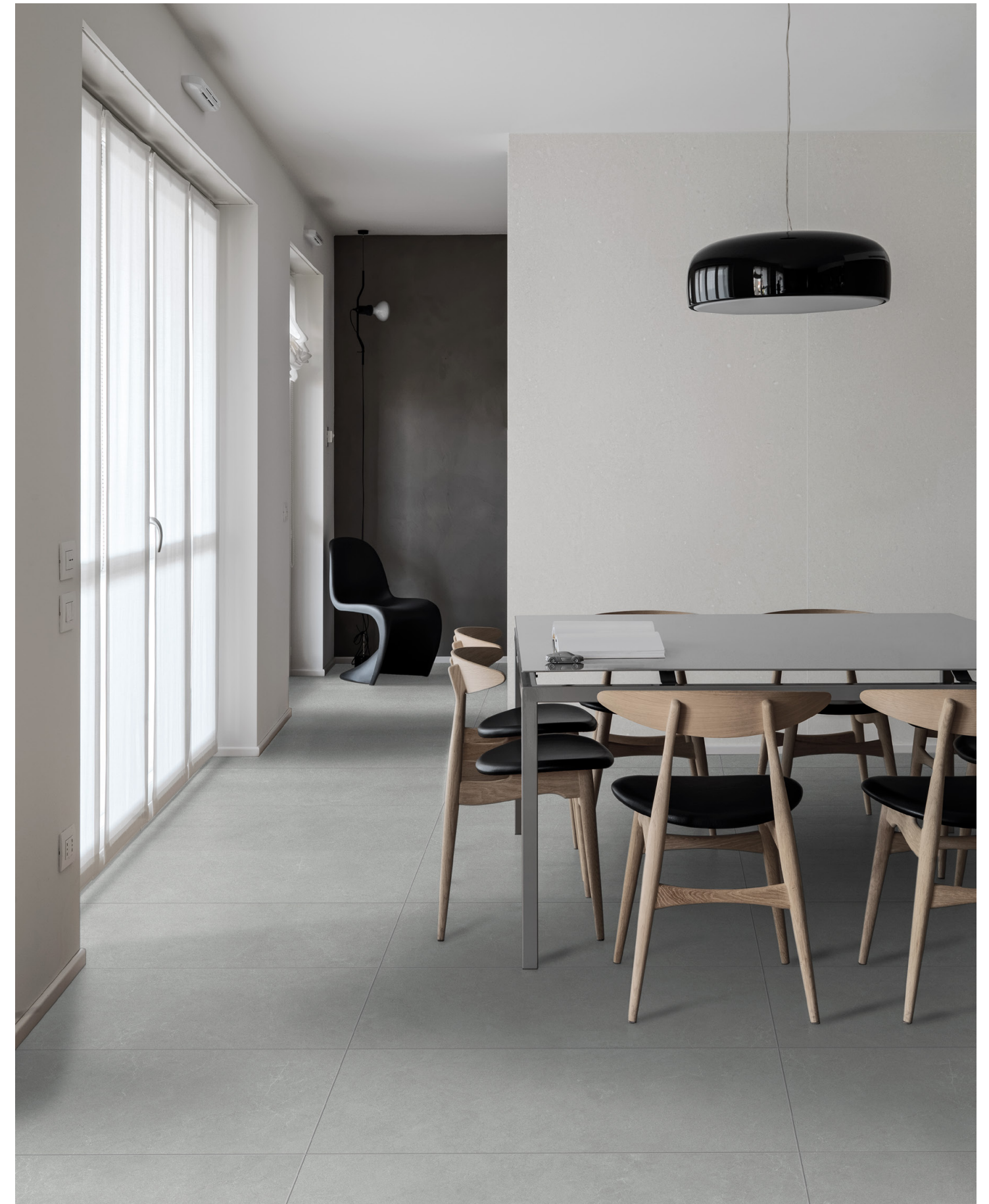
▼ ASTOR GREY 60x120 | 24"x48"