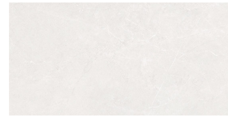
ASTOR | WHITE