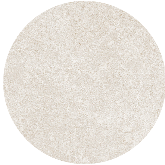
▼ ASTOR WHITE 75x75 | 30"x30"

ASTOR is an elegant and sophisticated porcelain collection, with a very subtle grain that runs through the piece and is integrated into the material, it is an alternative to natural stone, without losing performance or beauty. Available in 2 finishes to meet both flooring and cladding, with the needs of any project.