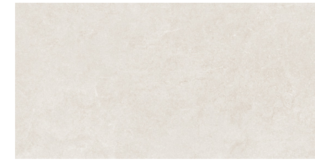
ASTOR | SAND