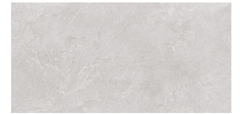
ASTOR | GREY